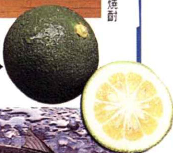
大分 カボス ▶