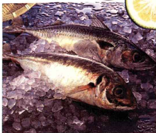
▲ 関あじ 関さば